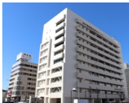
横浜市社会福祉センター